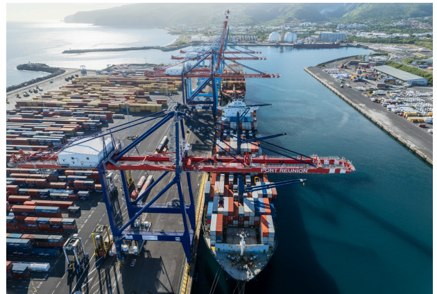
Le Port Est

Pour les compagnies MSC et CMA CGM, La Réunion a la double casquette. Sur la ligne baptisée NWC to Ipak de MSC, le port réunionnais est une escale majeure, mais il est secondaire sur la route nommée IOI, au départ du hub de Colombo. De même, au sein de la stratégie de réticularité adoptée par CMA CGM, Port Réunion est tout à la fois, un nœud régional de redistribution, un port feedérisé et une escale directe sur une route majeure. Ainsi, des routes partent du port d'éclatement de La Réunion pour irriguer les autres ports insulaires régionaux (lignes IOIFEEED1 et IOIFEEED5). Ce rôle de hub est accentué eu égard à son périmètre de desserte sur la ligne Karibu (route jusqu'à Khalifa, via Mombasa et Mogadiscio). Il est desservi directement sur la ligne New Nemo (entre Europe et Australie). La Réunion est également touchée par des lignes feeders de CMA-CGM, comme la ligne Mozex qui court entre le hub de Tanjung Pelepas et le Mozambique.