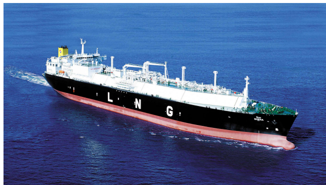
Un méthanier à cuves prismatiques

Le développement récent de nouveaux projets de liquéfaction dope la croissance des capacités de transports de GNL : ainsi en 2005, la flotte mondiale de méthaniers s'élevait à 191 navires pour une capacité totale de 23 millions de m 3 (13 millions de tpl) 1 et les commandes en cours représentent 90% des capacités existantes.